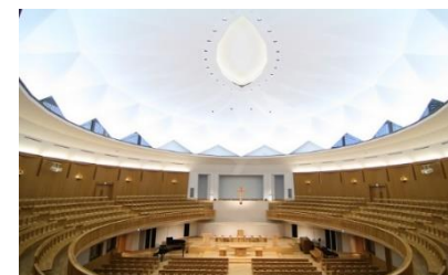
楕円形の壁と、その上に浮かぶ幕屋のような天蓋

2004年10月チャペルと関連施設が完成し、11月23日には献堂式が挙行されました。